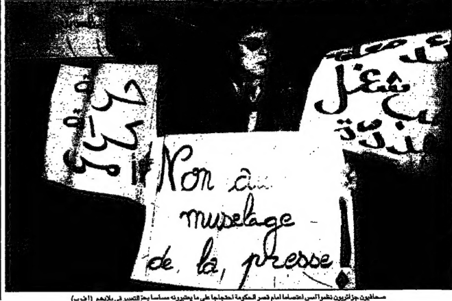
مخاضيون جزائريون يطرحون أسئلة انصافا امام عدم تمكنه احتجاجا على ما يتخبرونه مسلحا ضد تقييد حرية الصحافة

الجزائر (الشرق الأوسط) - قال وزير العدل الجزائري عبد الحميد بن باديس، في بيان له اليوم، إن ستة أشخاص اعتقلوا في أعمال عنف بالجزائر. وأضاف بن باديس في بيان له اليوم، إن ستة أشخاص اعتقلوا في أعمال عنف بالجزائر. وأضاف بن باديس في بيان له اليوم، إن ستة أشخاص اعتقلوا في أعمال عنف بالجزائر. وأضاف بن باديس في بيان له اليوم، إن ستة أشخاص اعتقلوا في أعمال عنف بالجزائر.